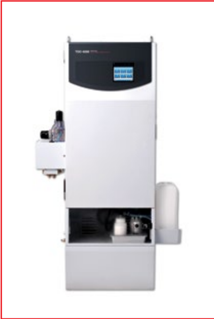
Фото № 4. Промышленный 6-канальный ТОС-анализатор модели ТОС-4200

скающих аппараты для получения особо чистой воды.