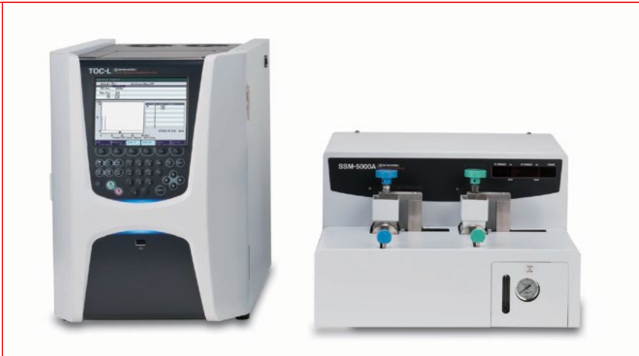
Фото № 3. Лабораторный TOC-анализатор модели TOC-LCSH в комплекте с приставкой для анализа твердых проб SSM-5000A

ния общего органического углерода в воде различной степени чистоты и в твердых пробах, но также и с определением общего связанного азота (с применением дополнительного хемилюминесцентного детектора).