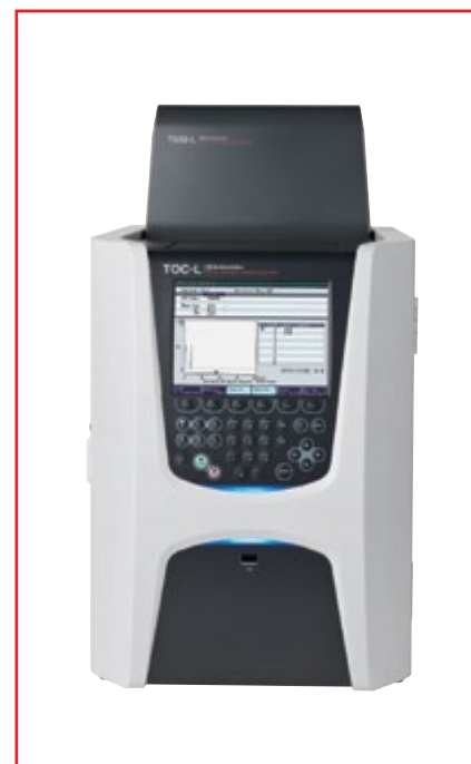
Фото № 2. Лабораторный ТОС-анализатор модели TOC-LCSH в комплекте с блоком для определения общего связанного азота TNM-L