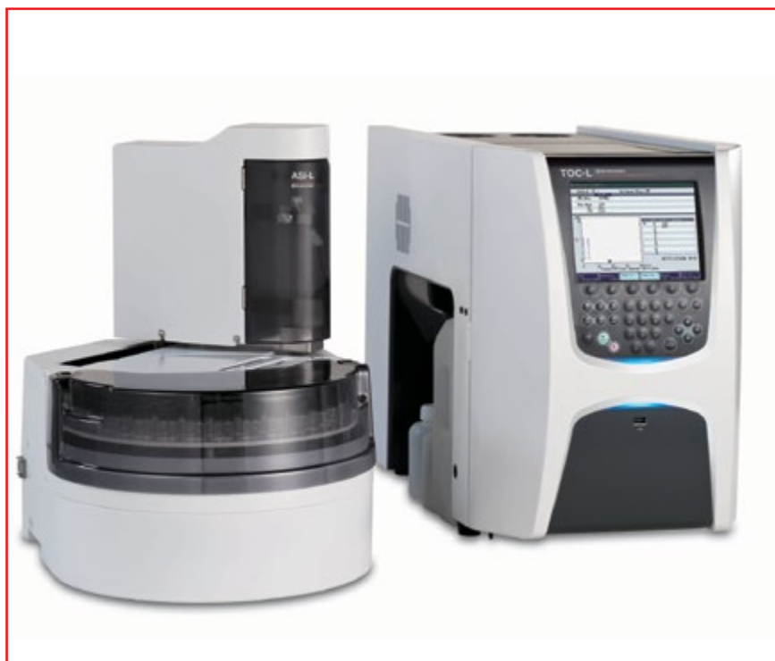
Фото № 1. Лабораторный ТОС-анализатор модели TOC-LCSH в комплекте с автосамплером ASI-L

В настоящее время многие предприятия Украины успешно используют ТОС-анализаторы SHIMADZU, работающие именно по методу низкотемпературного каталитического окисления, для решения задач, связанных не только с определением содержа-